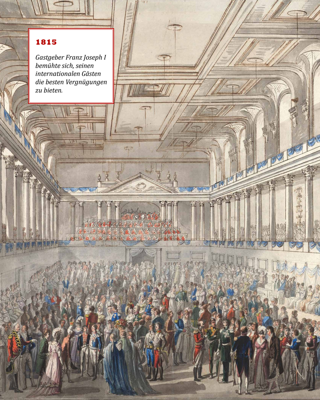
Die erste Rotkreuz Ball . . . auf dem Saale des Josephsplatzes in Wien am 1. März 1815.

Gastgeber Franz Joseph I bemühte sich, seinen internationalen Gästen die besten Vergnügungen zu bieten.