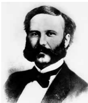
Henry Dunant, Schlacht von Solferino